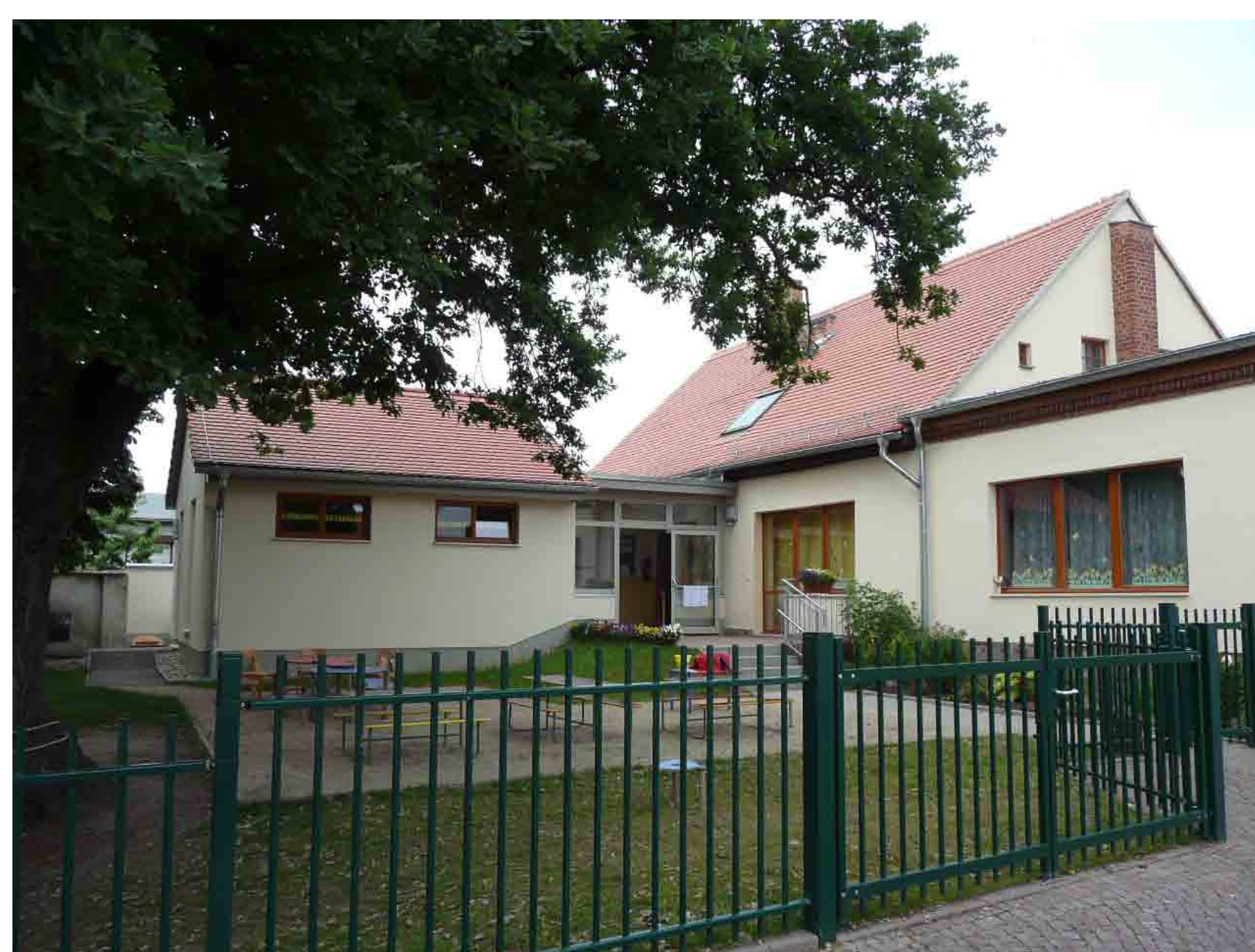
Anstaltsgasse - Evangelischer Kindergarten