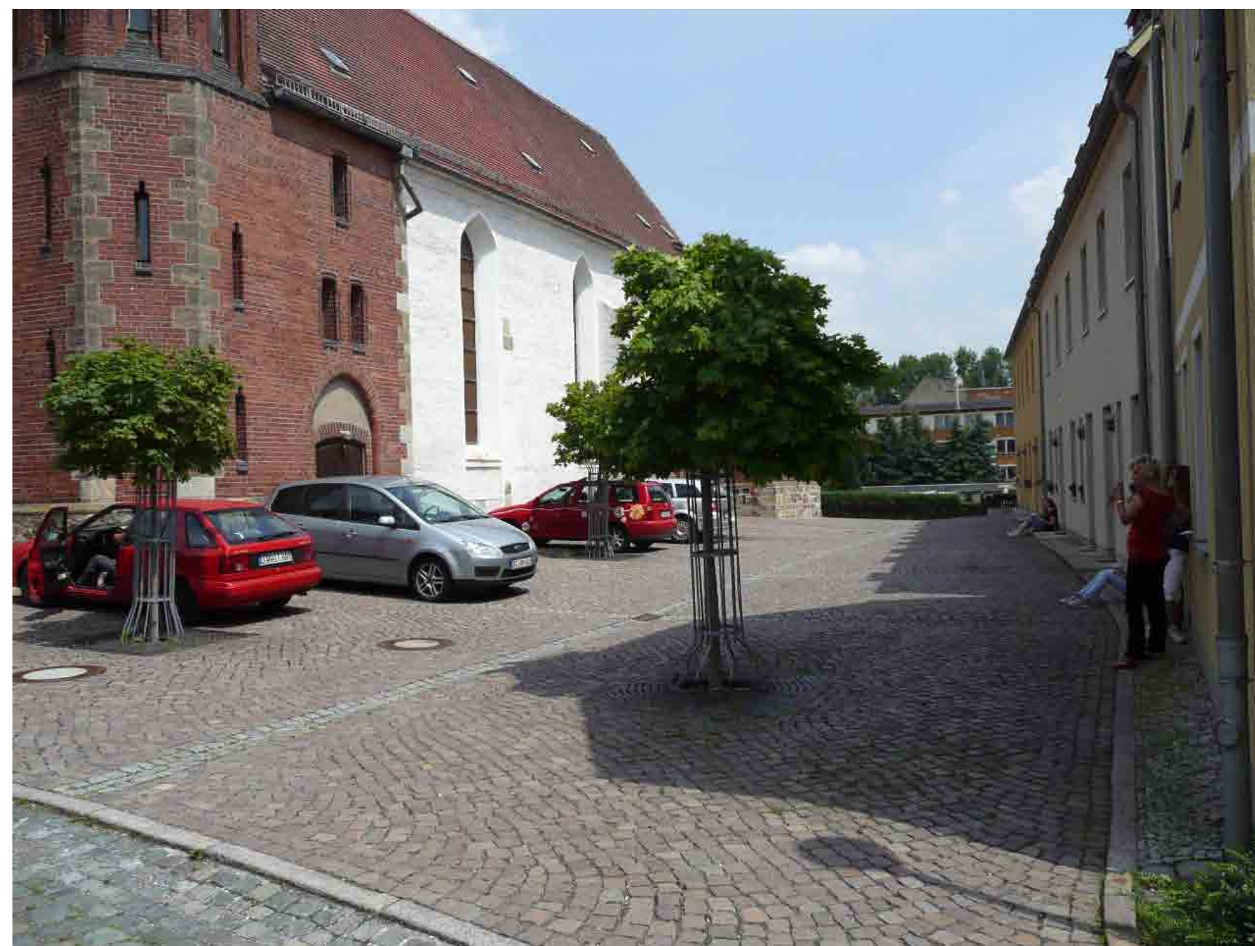
St. Albanus - Pflasterung Umfeld