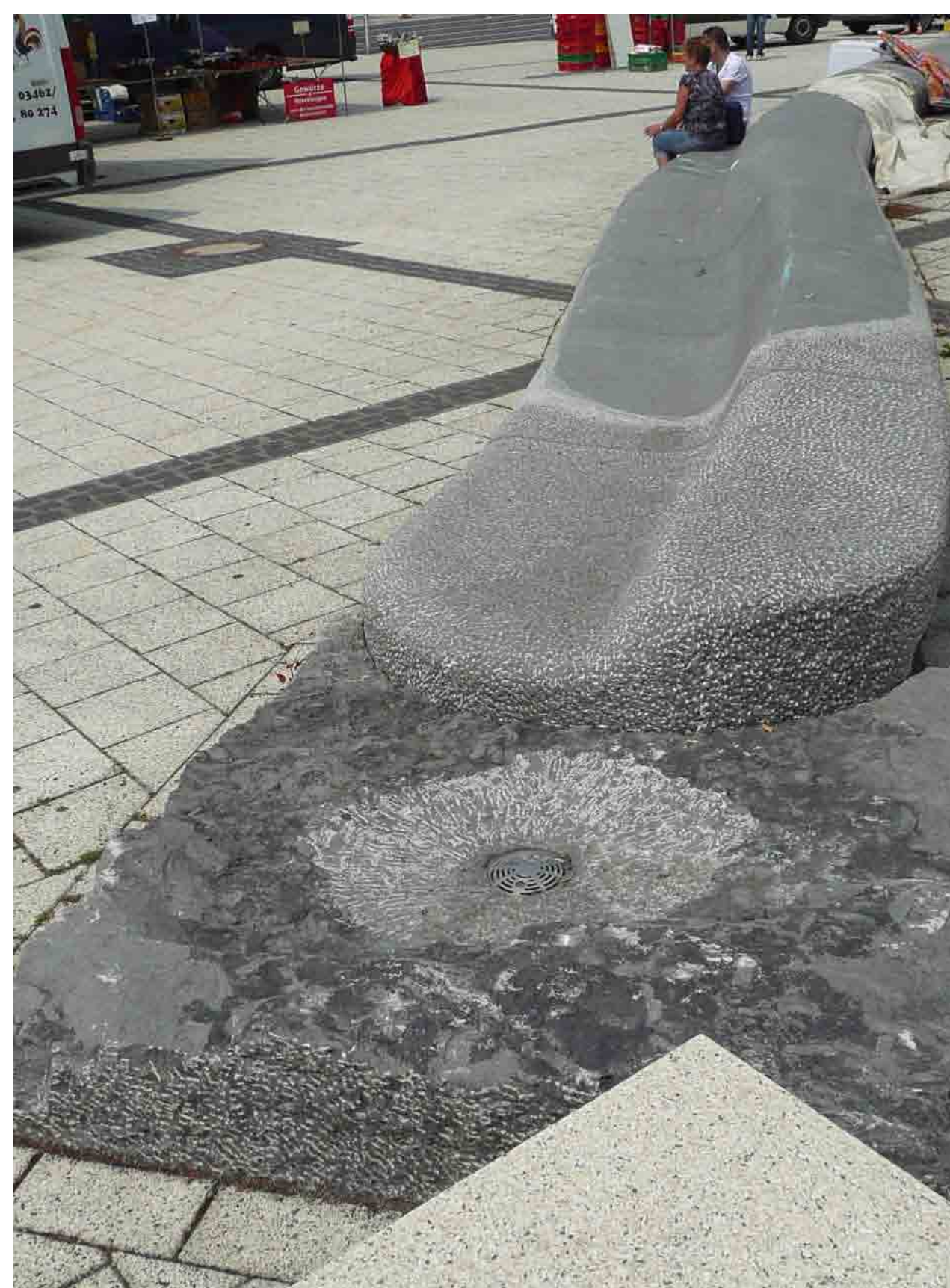
Markt - Sitzbrunnen-Sofa