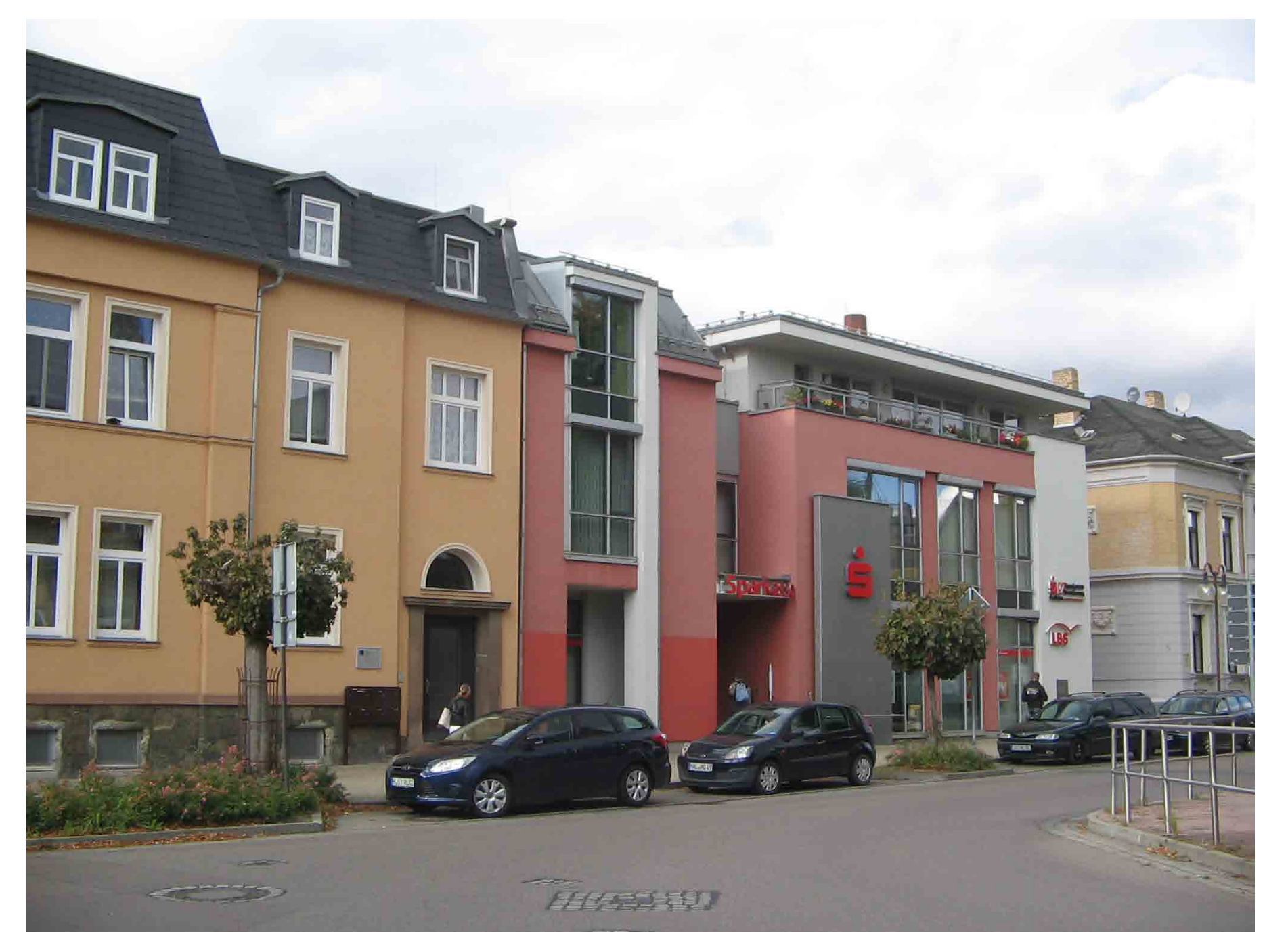
Bahnhofstraße 3 - Sparkasse