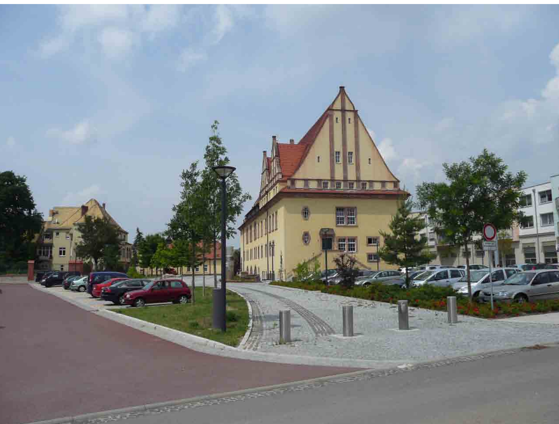
Lessingstraße - Gehweg zum Rathausplatz