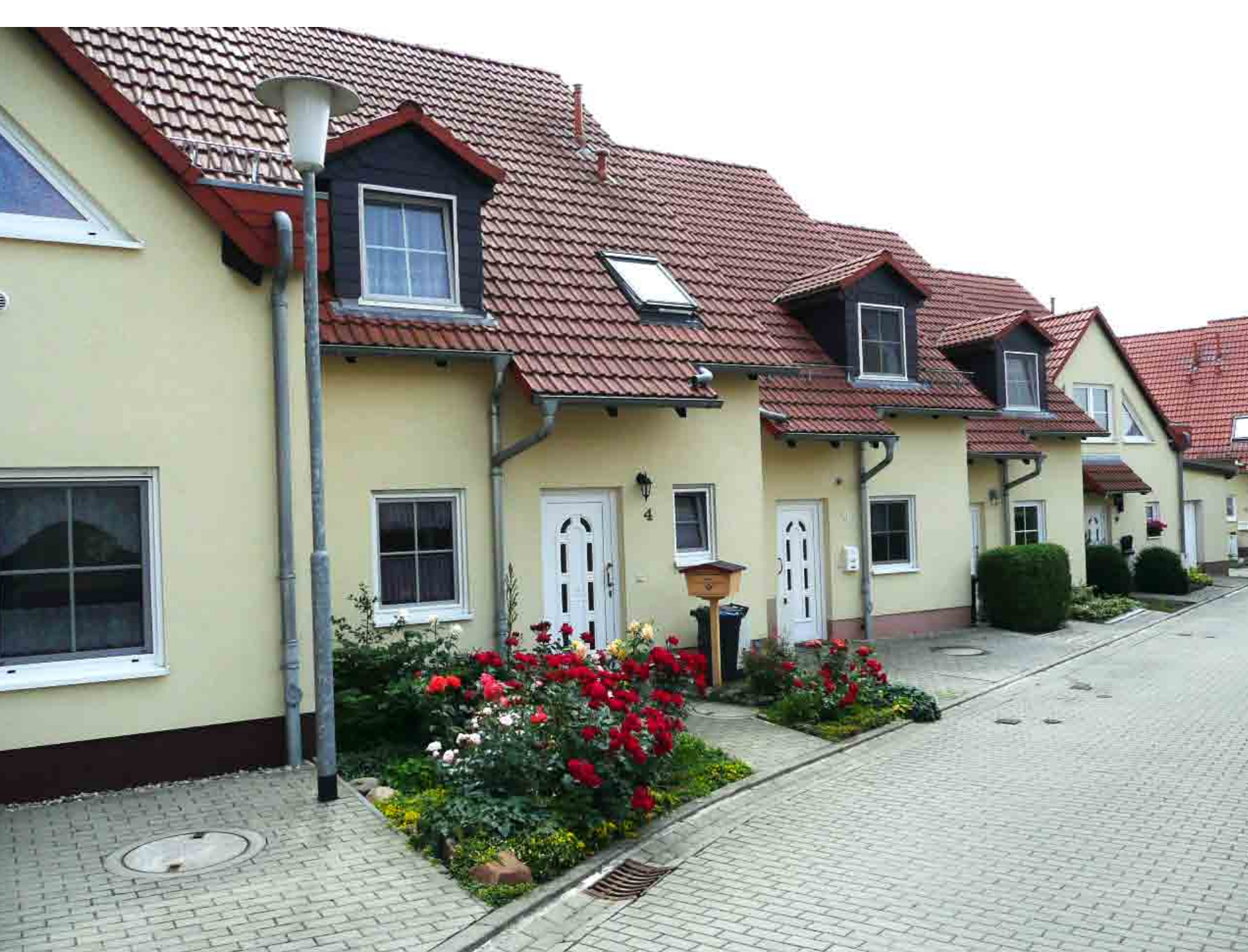
Sattelhof - Reihenhausanlage