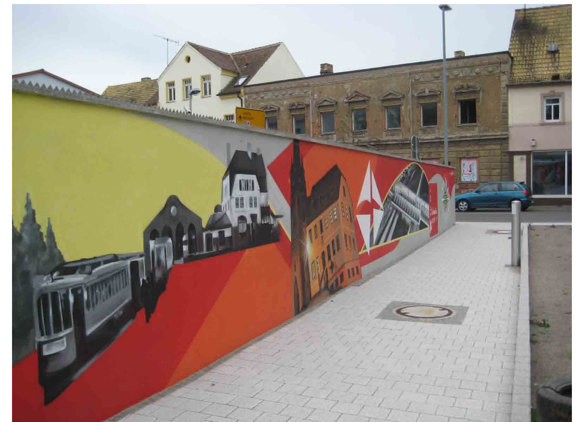
Gehweg zwischen Hallesche und Ringstraße