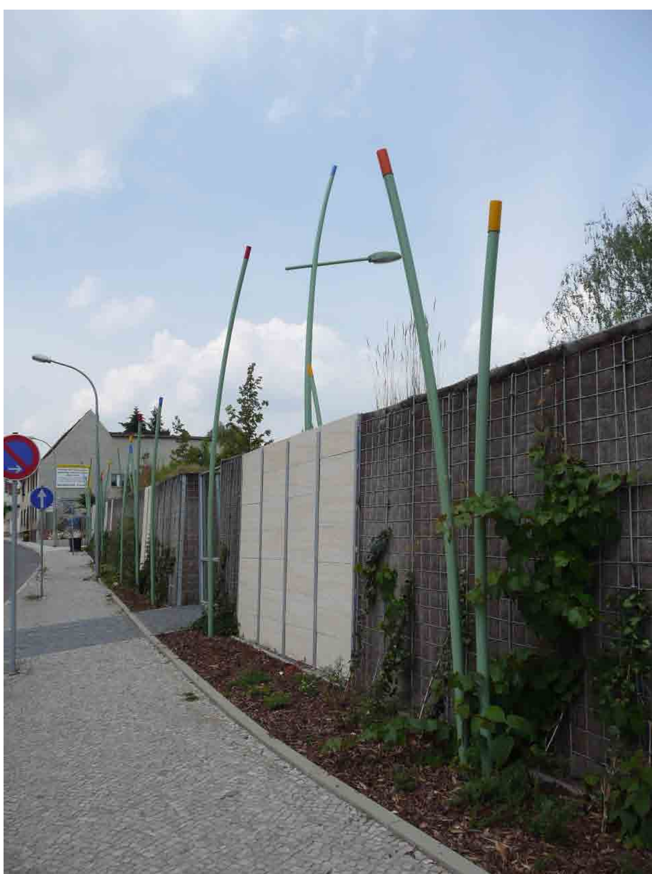
Leipziger Straße - Lärmschutzwand